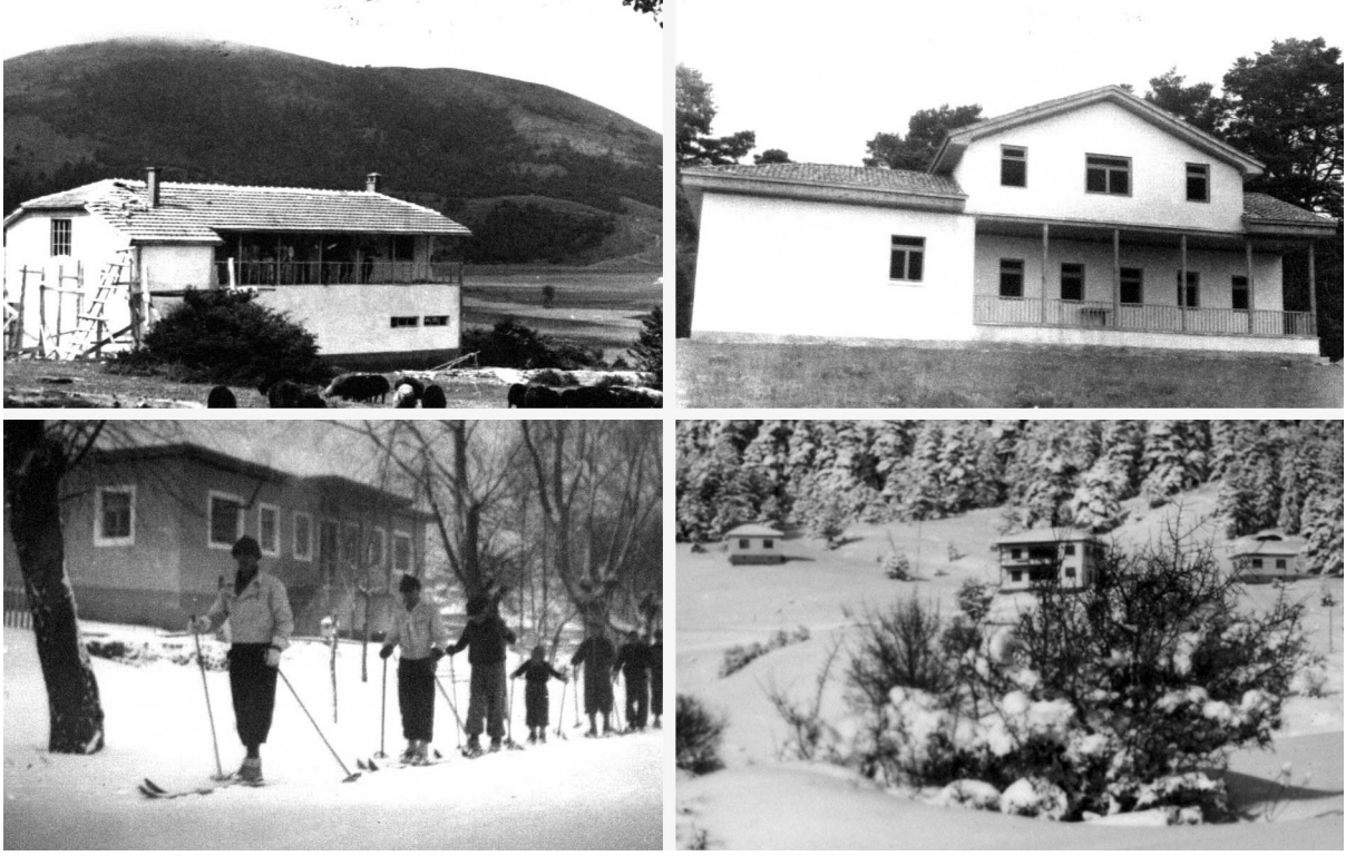
Görsel 2. Bolulu kayakçıların konaklama ve kamp dönemlerinde kullandıkları tesisler. (BCA. 490.1 /1101.22.1; https://archives.saltresearch.org/handle/123456789/195595 )

Turistik Abant ve çevresinde uzun süre organize bir kayak faaliyeti yürütülmemiştir. Günümüzde Abant'ta kayak faaliyetleri daha çok özel işletmecilerin pistleri ile yürütülmektedir. 1970'li yılların ikinci yarısında açılan tesisler ile Bolu'da kayak faaliyetleri Kartalkaya'ya kaymıştır. 1982 yılında turizm bölgesi ilan edilen Kartalkaya'da bulunan 5 konaklama tesisi toplam 1600 yatak kapasitelidir. Kartalkaya Kayak Merkezi'nde toplam 40 kilometre uzunluğunda 25 adet pist bulunmaktadır. 87