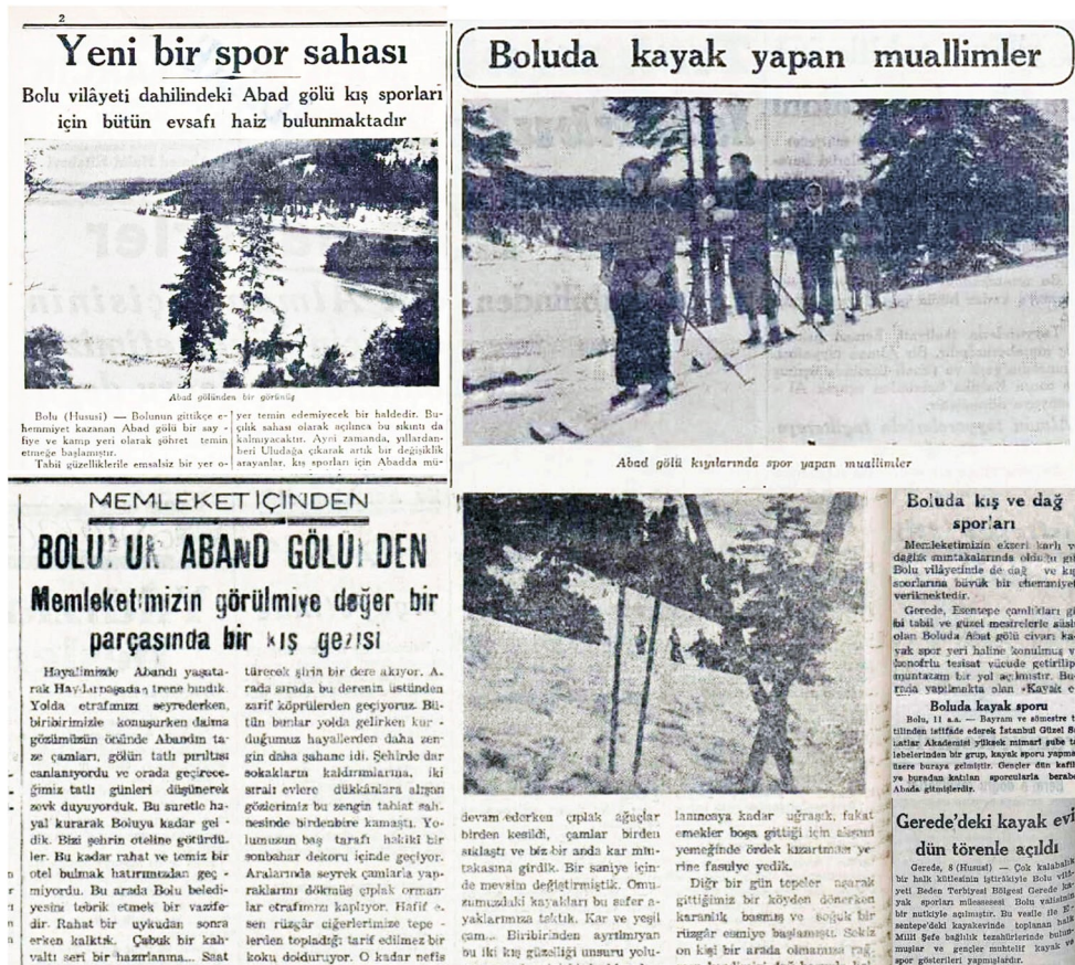
Görsel 1. Bolu'da yürütülen kayak çalışmalarına dair Cumhuriyet, Son Telgraf, Ulus ve Haber gazetelerinde yayımlanan haberler.

Cumhuriyet gazetesinde 1939 yılı aralık ayında yayımlanan bir haberde Abant Gölü'nün 1.300 rakımda bulunduğu ve kış aylarında tamamen donduğu yazılmaktadır. Bir arabanın üzerinden geçebileceği sertlikteki buz tabakası üzerinde buz pateni benzeri kış sporları yapılabilmektedir. Gölün batı yönü kayak sporuna uygundur. Ayrıca Abant ormanında da kayakçılar için ideal alanlar bulunmaktadır. Gazete, Abant'ın Uludağ'ın kalabalığına tercih edilebilecek mükemmel bir alan olduğunu yazmaktadır. Şose yolların tamiriyle Bolu merkezinden ve diğer ilçelerden rahatlıkla ulaşılabilen Abant, Tatova (Yolçatı) geçildikten sonra, yol üzerinde dörder kilometre arayla kurulmuş köyler nedeniyle sığınağa ihtiyaç duyulmadan ulaşılabilen bir alandır. Göl çevresinde yer alan üç yapı kayakçılar için barınak olabilecek durumdadır. Ayrıca bölgede Bolu Valiliği de bir kayakevi yaptırmaktadır. Gerekli tesisleşme çalışmaları ardından Abant Gölü Türkiye'nin ilk buz pateni pisti olacaktır. 70 Abant Gölü çevresinde bulunan üç yazlık mekânın yanına bir kayakevi yapılmıştır. Bu kayakevine yakın bölgelerle iletişim kurabilmek için bir de telefon hattı çekilmiştir. Artık bir kayakevi de bulunan Abant bölgesi yalnızca Bolulu öğretmen ve öğrencileri ağırlamakla kalmayıp, kısa süre içerisinde İstanbul'dan kayak sporuyla ilgilenenleri de çekmeye başlamıştır. 71