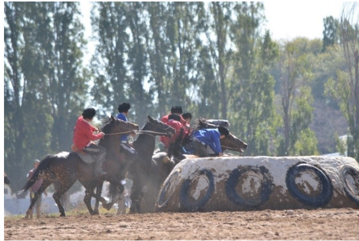
Görsel-7: 2014 Dünya Göçebe Oyunlarında kullanılan tay kazanlar ve kökbörü mücadelesi https://worldnomadgames.com/ru/galleries/ (son erişim tarihi: 07.10.2025)