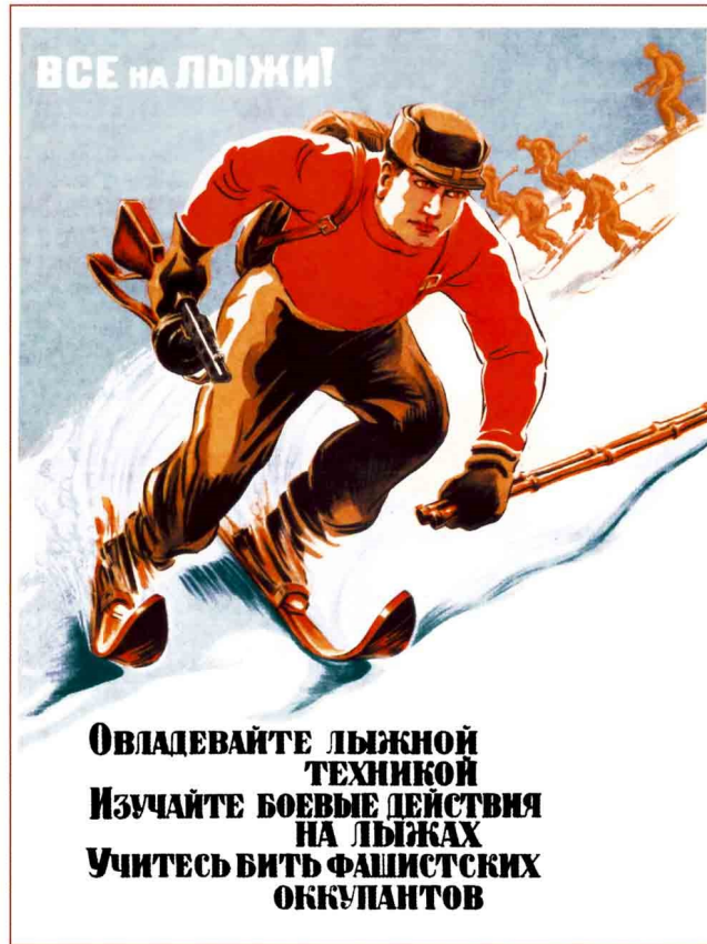
Görsel 2: Herkes kayak yapmaya 78