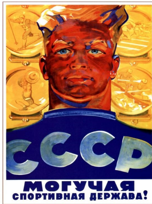
Görsel 3: Sovyetler Birliği güçlü bir spor ülkesidir 82

Afişteki en temel amaç, Sovyet yurtseverliğini spor yoluyla teşvik ederek insanların savaş içinde aktif rol almasını sağlamaktır. Burada bir yurtseverlik miti de oluşturulmuş ve gösterilen kayakçılar birliktelik içerisinde gösterilmiş ve “Herkes kayak yapmaya” ve “birlik” mesajıyla grup psikolojisi yaratılmaya çalışılmıştır. Bu nedenle, Sovyet propagandası için duyguları ortaklaştırmak savaş döneminde büyük önem taşımaktadır. Burada, salt bir spor propagandasından bahsetmek yetersiz olmakta, Sovyet insanının yalnızca kayak sporunu yapmak için özendirildiği çıkarımı eksik kalmaktadır. Bu anlamda spor üzerinden yapılan bu propagandanın, savaş için de anlamlı olduğu ve toplumu bir araya getirmek üzere ve bütüncül bir şekilde kurgulandığı gözlemlenmektedir.