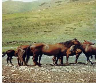
Görsel-4: Novo-Kırgız tipi atlar