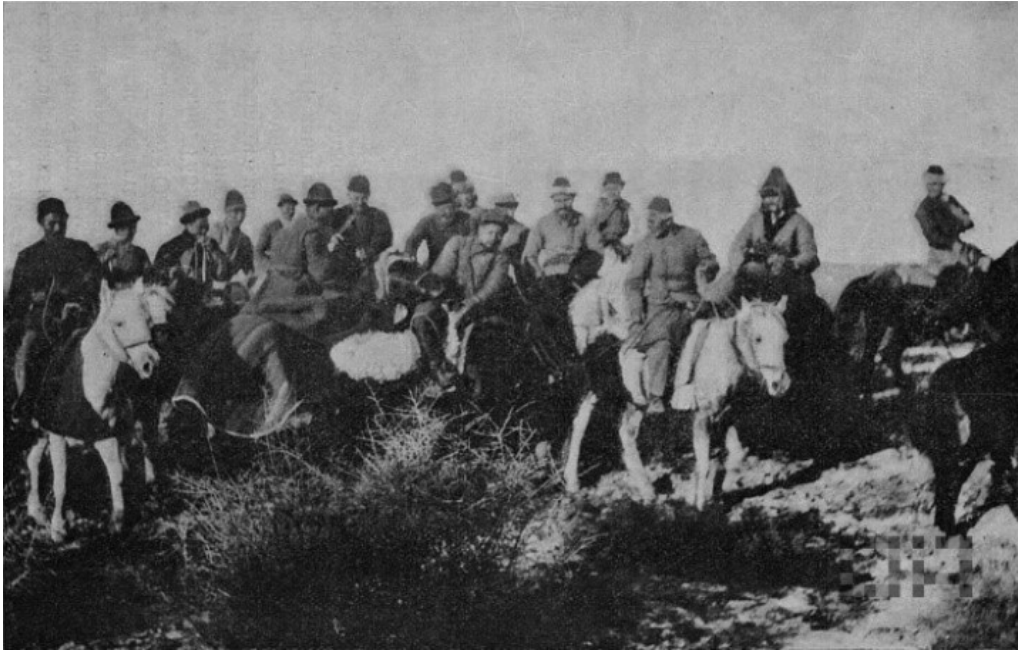
Görsel 1: Sir-i Derya bölgesinde kökbörü mücadelesi (1914) Yamzin, İ. L., Rossiya. Pereselençeskoe Upravleniye , s.41.

Kökbörü oyunu Türk kültür tarihinde yalnızca belli bir dönemle sınırlı kalmayarak devamlılık arz eden bir görüntüyle karşımıza çıkar. Bu vaziyet içerisinde, oyunun doğuşu ve gelişim merhaleleri veya bozkırlılar için taşıdığı anlamı sorgulamamız gerekmektedir. Kültür tarihçileri, antropologlar ve etnograflar, uygarlık tarihi boyunca çeşitli coğrafyalarda neşet eden oyunlarla ilgili bazı çıkış teorileri üzerinde durmuşlardır. Bu anlamda oyunların kökenleri sık sık mitolojik imgelerle izah edilmeye çalışılmıştır. 11 Nitekim bazı oyunların icra zamanları özel günlere denk gelmektedir ki bunlar arasında; mevsim dönümleri, takvimsel değişiklikler, taht merasimleri ve ölüm merasimleri gibi zamanlar sıklıkla öne çıkmaktadır. Kökbörü oyununun tarihi gelişimine baktığımızda da benzer bir durum dikkat çekmektedir. Modern dönemlere kadar oyunun icra günleri için bir takım özel tarihlerin belirlendiğini görmekteyiz. Bu da kökbörünün sıradan bir eğlence yahut vakit geçirmek için oynanan bir oyun olmadığını düşündürmektedir. A. Kaliul, Kazak boyları arasında oynanan kökbörünün doğuşunu, bozkırlıların savaş sanatına dair duydukları ihtiyaca bağlamıştır. 12 Bu çerçevede oyunların yalnızca bir boş zaman aktivitesi olarak değerlendirilmemesi gerektiğini ve birçok oyunun kökeninde “zaruretin” yattığını, bir ihtiyaç dolayısıyla ortaya çıkıp, yayıldıklarını belirtmeliyiz.