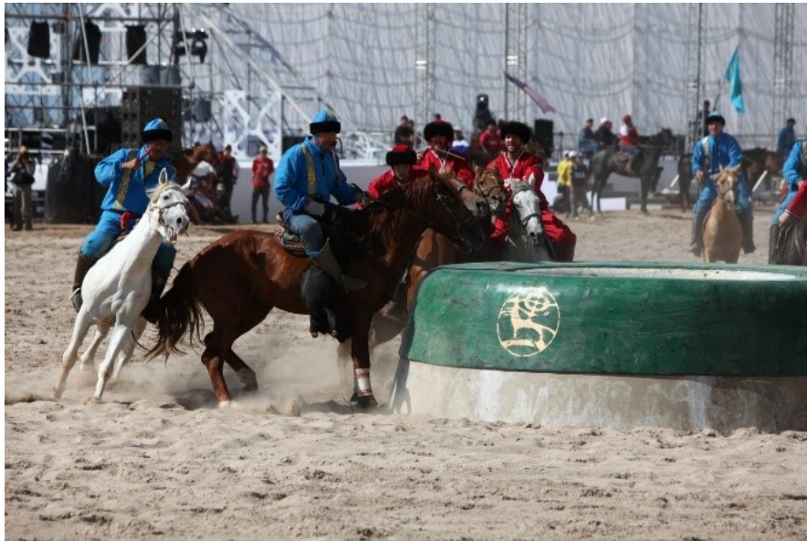
Görsel-8: 2016 Dünya Göçebe Oyunlarında kullanılan tay kazanlar ve kökbörü mücadelesi https://worldnomadgames.com/ru/galleries (son erişim tarihi: 7.10.2025)