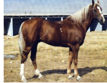
Görsel-5: Lokay atı