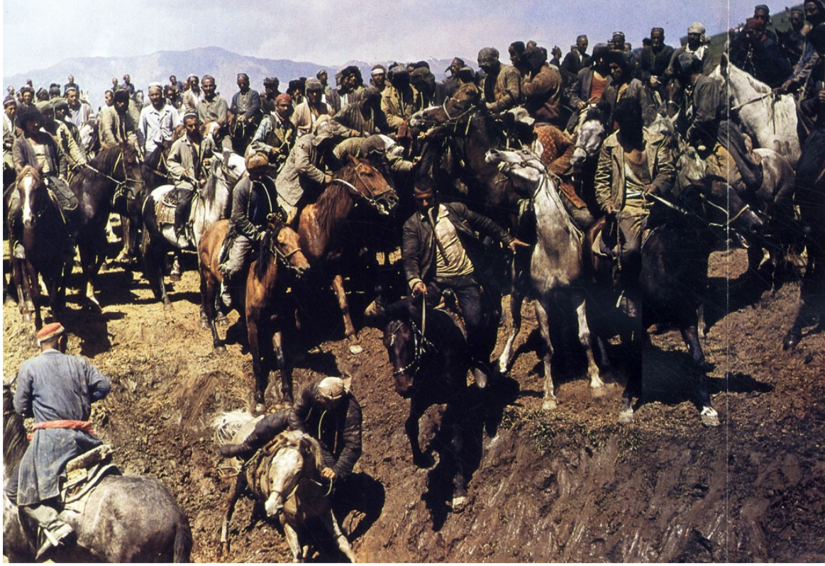
Görsel 2: Oyuna resmi kuralların gelişi öncesinde bir Kökbörü mücadelesi http://konevodstvo.su/books/item/f00/s00/z0000015/st007.shtml

Liderlik vasfına sahip olduğu düşünölen kimselerin halkı yönetme gücünü göstermek, halkın onurunu yüceltmek ve etrafa ün salmak gayesiyle bu oyuna ihtimam gösterdiklerini bildirmiştir. 15 Toktabay'a göre ise varlıklı iki adamın yahut boyun kökbörü mücadelesi kurdun kutsallığına duyulan inançla alakalı idi ve galiplerin hanesine mutluluk ve bereket girecek düşüncesi hakimdi. 16 Kökbörü oyununun temelinde iki grup arasındaki mücadele yatsa da bunun diğeri mitik karakterli oyunlardaki gibi iyi ile kötü ya da aydınlık ile karanlık arasındaki mücadele olarak görülmediğini ifade etmemiz gerekir. Oyun, yalnızca en güçlünün belirlendiği bir rekabetin ürünü idi. 17