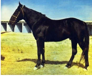
Görsel-3: Karabayır atı

-dirildiğinden bahsedilir. Buradaki gayenin atların bacaklarında oluşacak su toplamalarına ve koşma esnasında zorlamaya bağlı baş gösterebilecek diğer rahatsızlıklara karşı önlem amaçlı olduğu ifade edilmiştir. 27 Özbekler arasındaki kupkari oyununa hazırlanan atlara dair Umarov'un çalışmasında son derece ilgi çekici bazı gözlemlere de yer verilmiştir. Çilla süresi boyunca atlara ağırlıklı olarak arpa yedirildiği, bakım boyunca atların aynı yerde tutularak dışarı çıkarılmadığı, bu kırk günlük periyodun sonunda atın; içine andız otunun eklendiği bir suyla yıkandığı gibi ayrıntılar bunlardan bazılarıdır. 28 Djumaniyazova ve Nuriddinova'nın hazırladığı çalışmada Özbekler arasında atların 4-5 yaşından itibaren bu oyun için hazırlandığı ifade edilmiştir. Arttırılarak devam eden bir besleme döneminin ardından, 20-25 gün süren ve "qontaruv" adı verilen bir nevi diyet dönemine geçilmektedir. 29